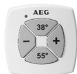
Zdalne sterowanie FBM Comfort