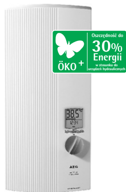
DDLE ÖKO TD