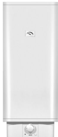
EWH Comfort Universal