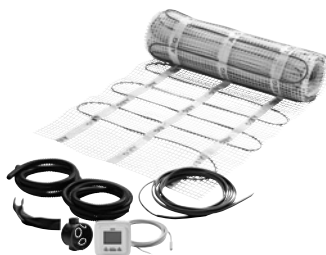
HMA TE 50 Set 150/...