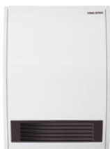
CK 20 S