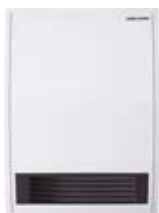
CK 20 S