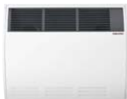
CON 10 S