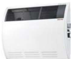
CON 10 ZS